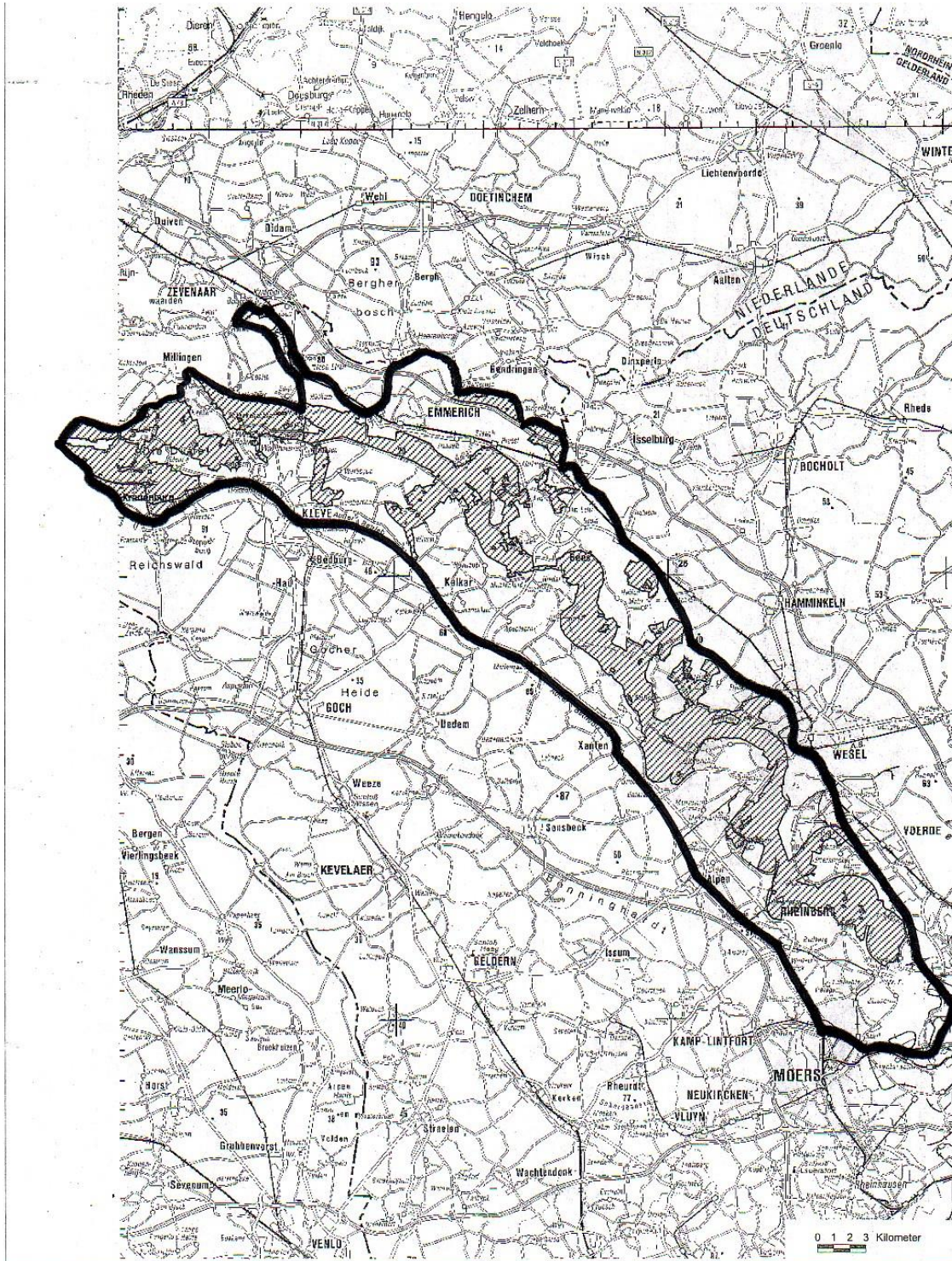
Schongebiet „Untere Niederrhein“ gem. § 2 Nr. 2 a) der LJZeitVO (Schraffierte Flächen = DE-4203-401 Vogelschutzgebiet „Untere Niederrhein“)